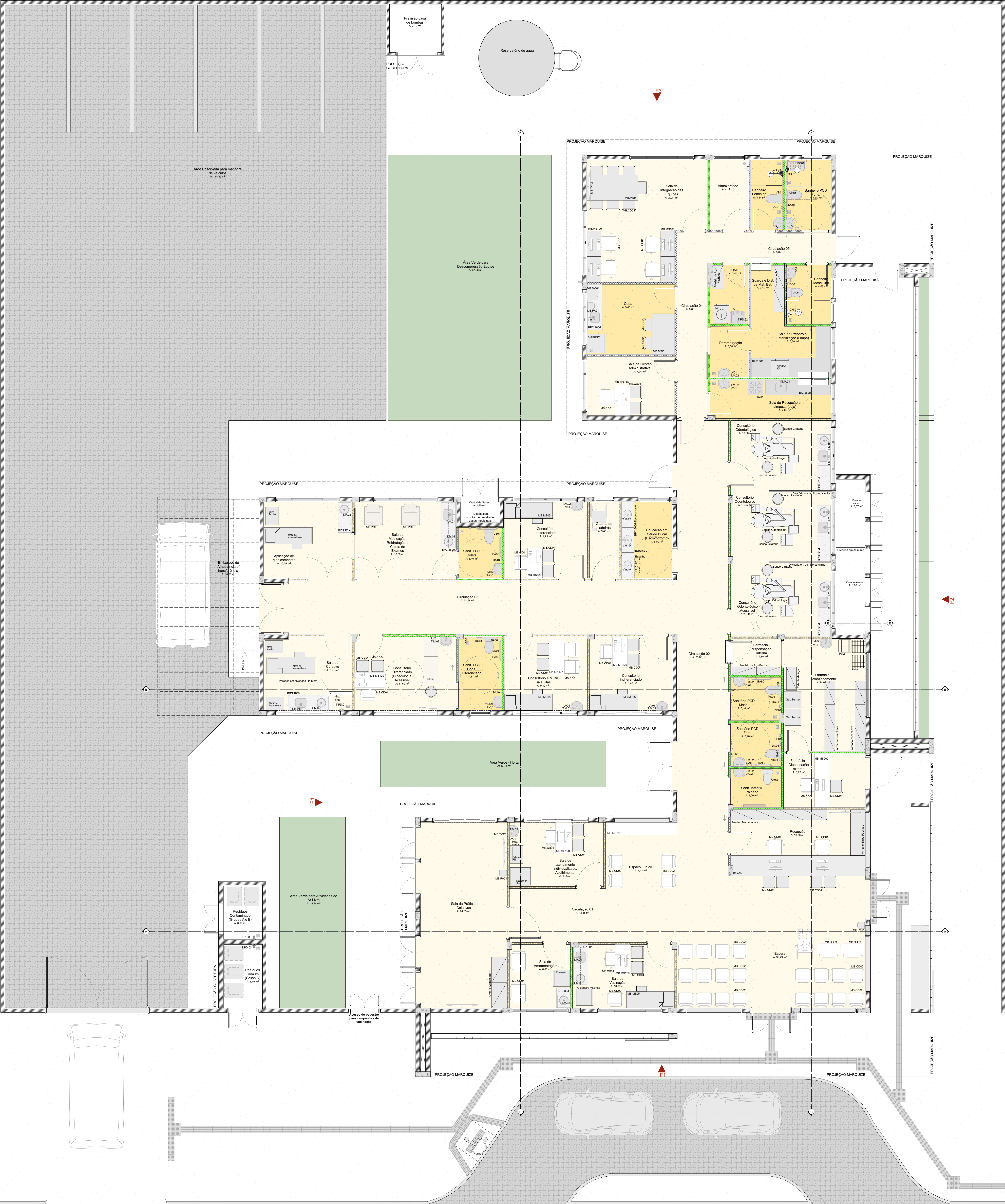
PLANTA DE LAYOUT Escala: 1:50